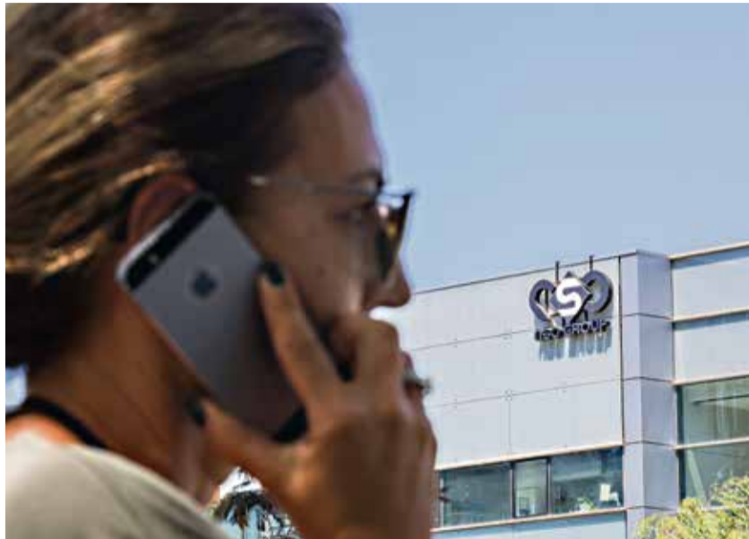
Le groupe israélien NSO serait derrière la conception du logiciel espion servant à prendre le contrôle d'un smartphone via l'application WhatsApp.

Selon le Financial Times , la vulnérabilité a été utilisée lors d'une tentative d'attaque du téléphone d'un avocat basé au Royaume-Uni le 12 mai. Le quotidien britannique ne mentionne pas son nom, mais affirme qu'il est impliqué dans une action en justice intentée contre NSO